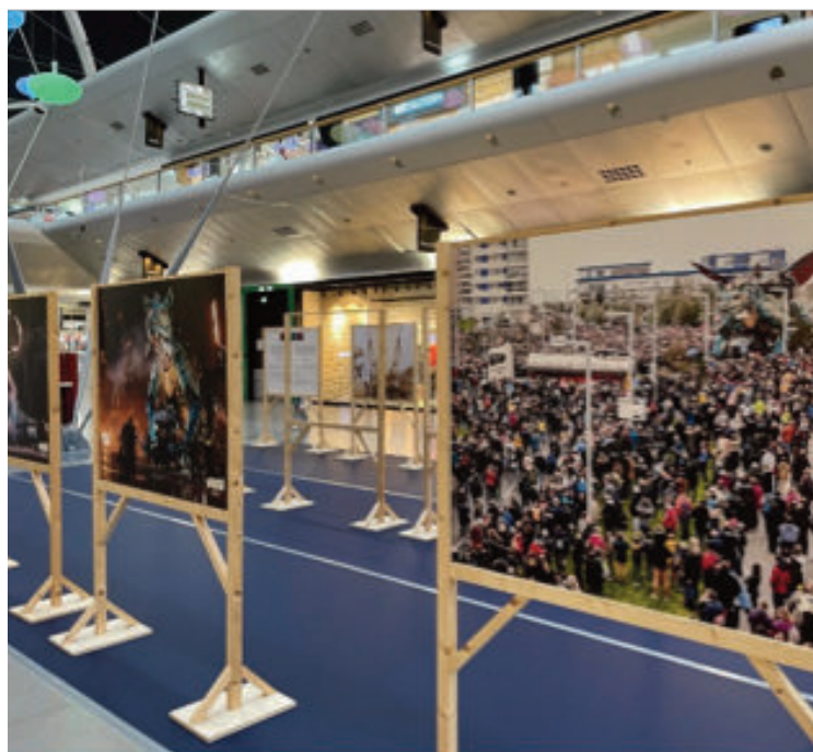
Site de Coquelles.