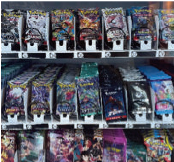
Distributeur de cartes boosters à Chambourcy.