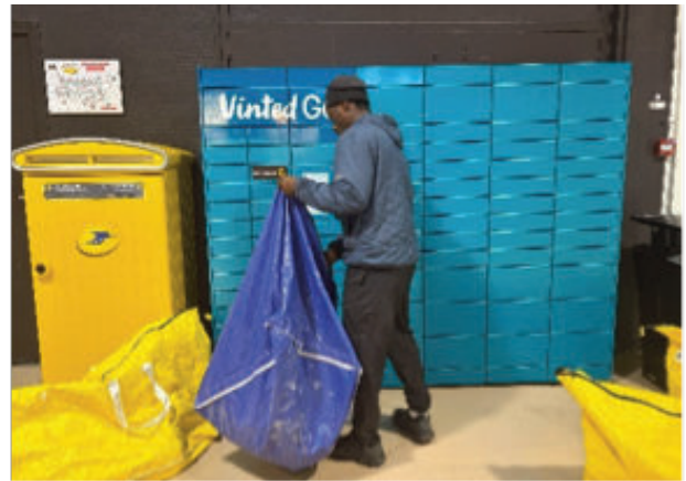
Livreur devant le casier Vinted Go à Chambourcy.