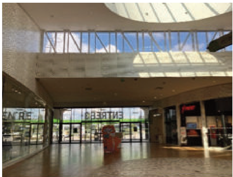
À gauche : site de Clair ; à droite : site de Housen.