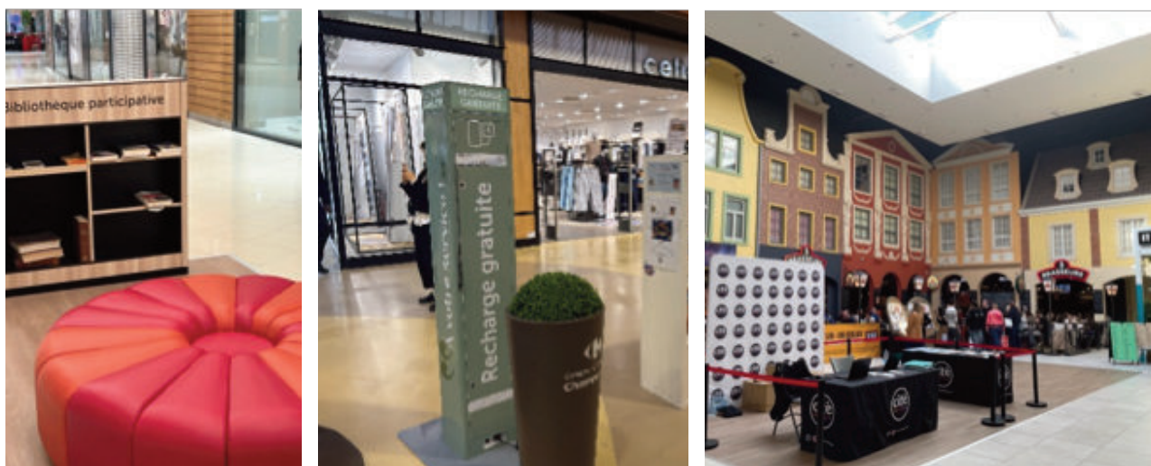
À gauche : site de Clairra ; au centre : site de Chambourcy ; à droite : espace de restauration sur le site de Coquelles.

bibliothèques participatives, développement d'une offre de restauration diversifiée et qualitative (notamment tournée vers les actifs en semaine) ; et, dans les rénovations récentes, une valorisation accrue de la lumière naturelle.