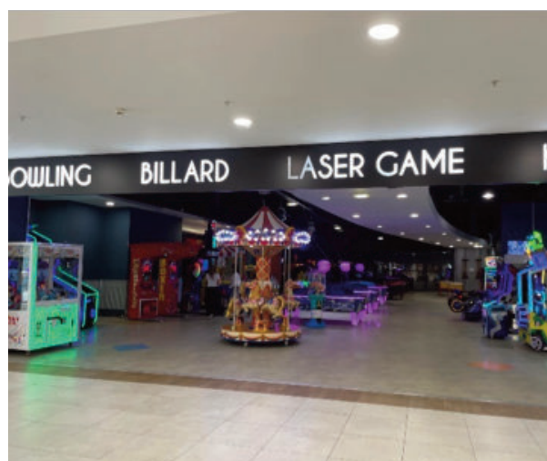
Salle d'arcade, site de Coquelles.