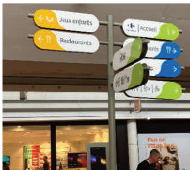
Panneaux de direction à Houssen.