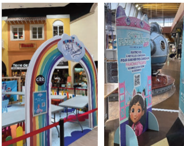
À gauche : site de Coquelles ; à droite : site de Chambourcy.

Certains « temps forts », reconduits d'année en année, finissent par s'installer comme des rendez-vous réguliers pour les familles. Ainsi, la « visite de Noël », ou celle d'Halloween, etc., devient peu à peu un repère dans l'année, attendu et intégré aux habitudes.